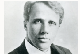
Robert Frost (1874 - 1963), USA