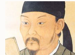
Du Fu (杜甫, 712-770), China

ペルシャ語文学史上最大の神秘主義詩人ジャラルール・ウッディーン・ルーミーの詩を紹介し、原語での朗読後、詩の「隠された意味」を探っていきます。