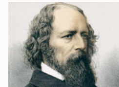
Lord Alfred Tennyson (1809-1892), England