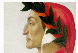
Dante Alighieri (1265 - 1321), Italy